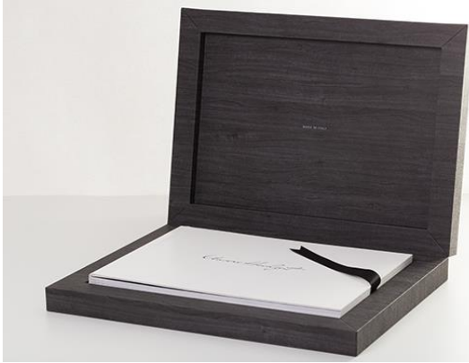
Das „Young Book“