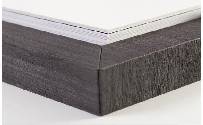
Das „Digital Matted Album“